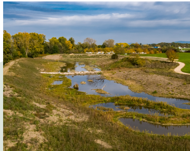
Le site de la promenade de la Doller.

Cette surface sera complétée par une plantation supplémentaire opérée par Rivières de Haute-Alsace, partenaire majeur de Mulhouse Diagonales, aux côtés de la Ville de Mulhouse.